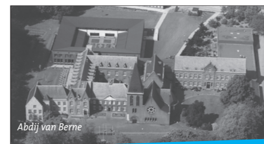
Abdij van Berne