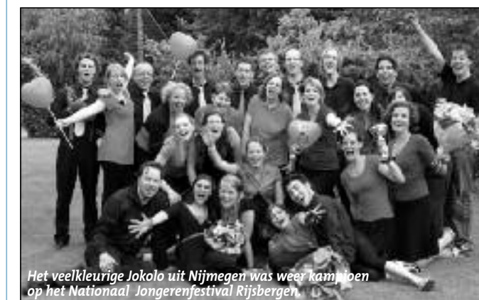
Het veelkleurige Jokolo uit Nijmegen was weer kampioen op het Nationaal Jongerenfestival Rijsbergen.

Ten tijde van de samenstelling van de bundel Gezangen voor Liturgie (GvL) zijn stevige discussies gevoerd over de voors en tegens van een basisrepertoire voor alle koren en of de nieuwe bundel daarin wel kon voorzien. Iedere liedbundel kent immers zijn eenzijdigheden en verraadt de voorkeuren van de samenstellers. Bevat GvL niet een grammetje teveel Oosterhuis? Had er niet wat meer leentjebuur gepleegd mogen worden bij de meer 'volkse' aanpak van onze zuiderburen? Zo is een selectie altijd voor kritiek vatbaar. Maar hoe je het ook bekijkt, na 27 jaar kun je de gezangen in deze wijd verspreide en meest geciteerde bundel toch zeker als ons basisrepertoire beschouwen!