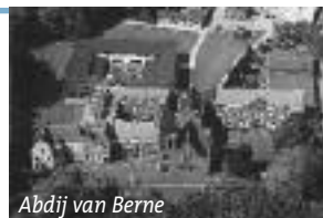
Abdij van Berne

Wie het eerst komt, die het eerst maalt: vol is vol. Vorig jaar hebben we tientallen mensen moeten teleurstellen!