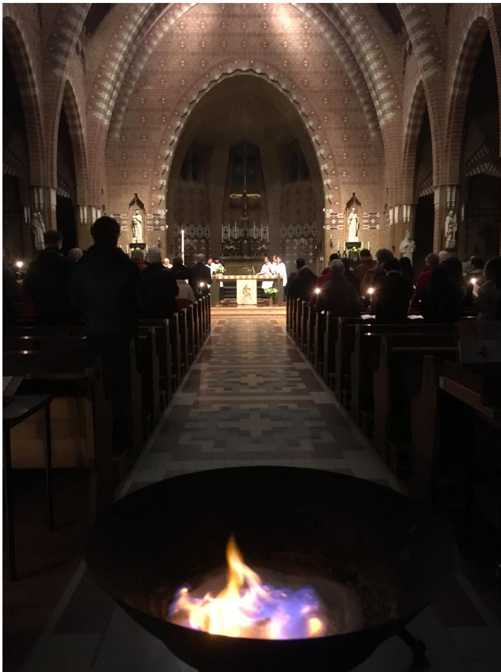
Foto: Paaswake 2019 Franciscuskerk te Groningen, foto is gemaakt door Anton Lukassen.